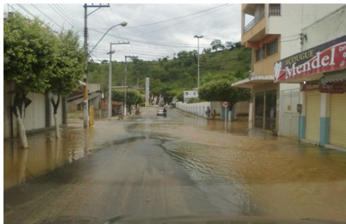
Rua Portela Salles às 17:00hs do dia 08/01

FOTOS entre 08:00h e 10:00h do dia 03/12