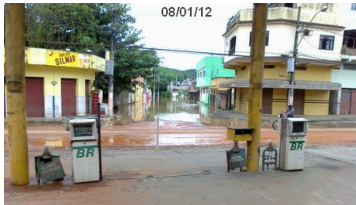
Rua Dr. Said Tanus José (antigo Colégio Santo Elias)